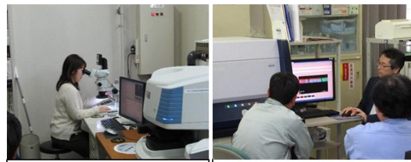
顕微FT-IR分析装置による測定