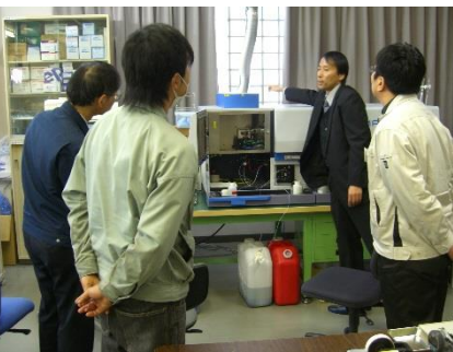
ICP発光分析装置による測定