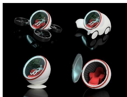
(講師による作画例)