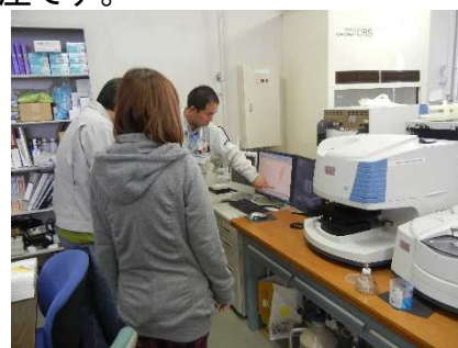
顕微FT-IR分析装置による測定