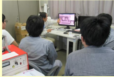
平成30年10月 分析技術実践講座