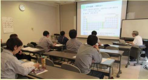
平成30年6月 分析技術基礎講座